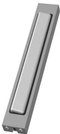
12 - 020